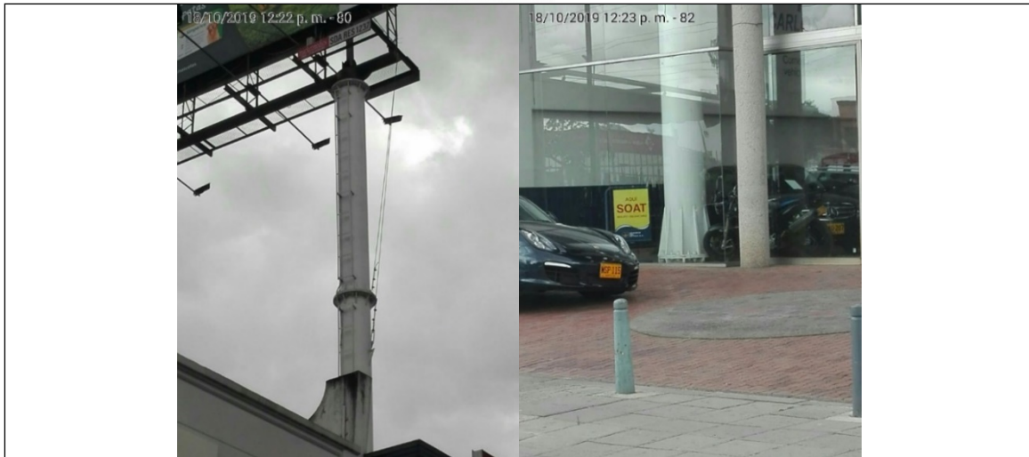
Foto No. 3 y 4: Detalles de la estructura y de la base de la valla tubular, en buenas condiciones y estable, instalada en la Av. Carrera 45 No. 137-12 (dirección catastral), orientación Norte-Sur.